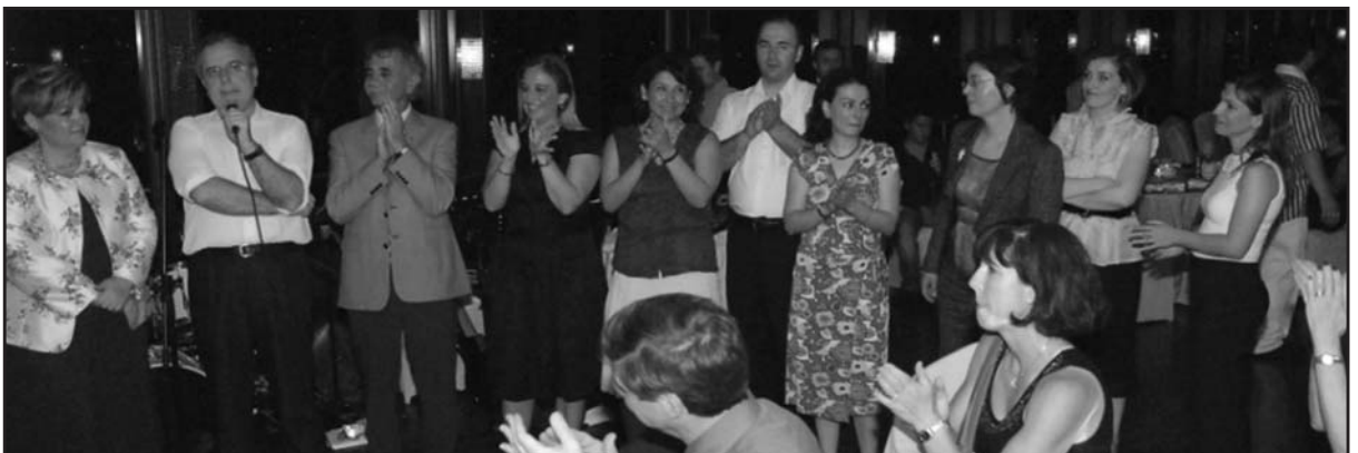
Tüm alkışlar Kongre Organizasyon Komitesine.